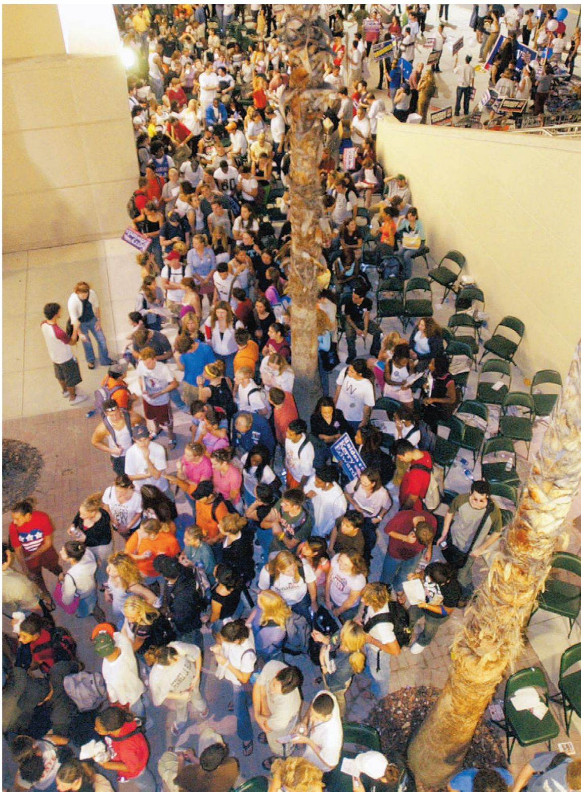
IN CODA Elettori in attesa di esprimere il loro voto nella notte, davanti al seggio dell'Università di Miami

Ma un'altra America, quella della frontiera e del Vecchio Testamento, gli rimane fedele. Conosce i suoi difetti e il suo semplicismo ideologico, ma ammira il suo dogmatismo e crede che persino i maggiori difetti, nei passaggi difficili della storia, possano dimostrarsi utili alla sopravvivenza della nazione. La politica di Bush ha avuto quindi l'effetto di riportare alla superficie, esaltare e irrigidire l'una contro l'altra le due grandi componenti dell'anima americana. Il Paese unito del 12 settembre 2001 è un Paese diviso. Non so ancora, mentre scrivo, chi governerà gli Stati Uniti nei prossimi quattro anni. Ma il nuovo presidente, chiunque sia, non potrà occuparsi soltanto di guerra irachena e crisi economica. Dovrà lavorare a ricomporre l'unità della nazione.